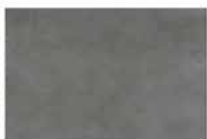
CEMENT DARK GREY