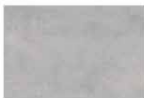
CEMENT LIGHT GREY